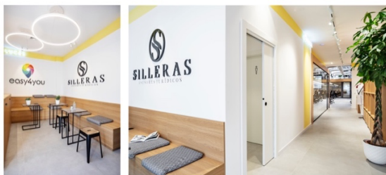
Mobiliario diseñado a medida por Raquel González en colaboración con Tribeka Estudio . Iluminación, de Luz Bilbao . Carril de focos del pasillo, de Flos . Pavimento porcelánico, de Iris Cerámica en Matimex .

Este primer ambiente, con luz natural procedente de la fachada principal, se ha concebido como un espacio polivalente en el que recibir al cliente, como zona de descanso para los trabajadores y como zona de reunión cuando no es necesario acceder a las oficinas. Raquel González ha optado por un equipamiento a medida cómodo y funcional con el que conseguir una atmósfera acogedora abierta y con acceso directo al pasillo que lleva a las oficinas. Las lámparas de techo circulares ayudan a dar una luz general y apoyan la luz natural que entra en este espacio desde la fachada.