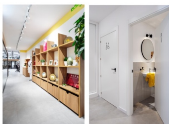
Mobiliario diseñado a medida por Raquel González en colaboración con Tribeka Estudio en rechapado de roble. Carril de focos del pasillo, de Flos .

Los bajantes y las instalaciones originales del local condicionaron la ubicación de los baños, que quedan a continuación de la zona de entrada. Y aprovechando la altura de esta zona, se ubicó a continuación de éstos, la sala de reuniones generando un pasillo que conduce desde la entrada directamente a la zona de trabajo. Unas estanterías abiertas en rechapado de roble cubren la pared de la derecha que, apoyada por un carril de focos en el techo, acompañan al trabajador o visitante hacia el fondo del local.